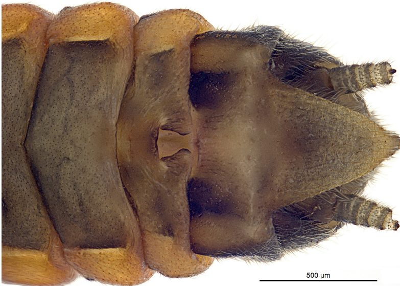
Abb. 5: Rhabdiopteryx acuminata , Abdomenende von ventral mit weiblichem Genital und Postgenitalplatte