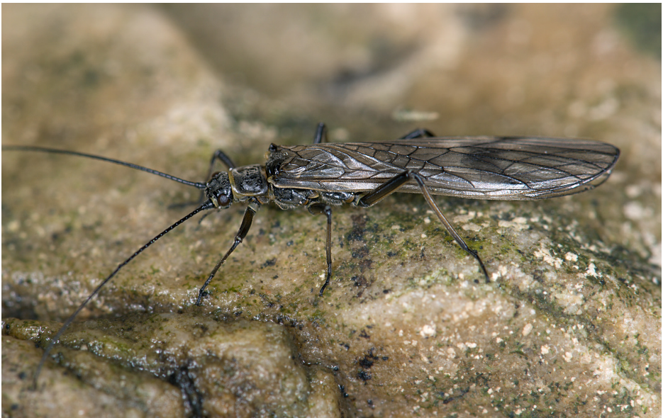
Abb. 2: Rhabdiopteryx acuminata , Ansicht von dorsolateral