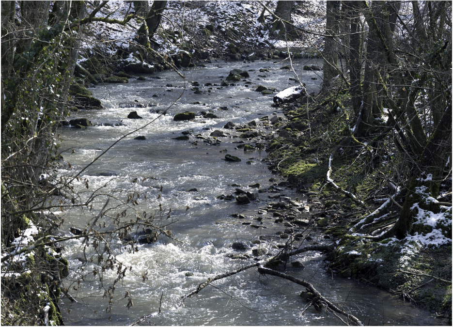
Abb. 1: Fundstelle am Goldersbach im Schönbuch bei Tübingen-Bebenhausen