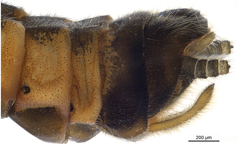
Abb. 4: Rhabdiopteryx acuminata , weibliches Abdomenende von lateral

Der Nachweis von R. acuminata im Goldersbach unterstreicht die überregionale Bedeutung dieses Gewässers und dessen Schutzwürdigkeit, was nicht zuletzt auch durch die Ausweisung des Naturparks Schönbusch als Teil des Natura 2000-Netzwerkes im Rahmen der FFH-Richtlinie bestätigt wurde. Derzeit wird das gesamte Makrozoobenthos des Goldersbaches in einer einjährigen Studie des Staatlichen Museums für Naturkunde Stuttgart beprobt, so dass in Kürze aktuelle Daten für eine detaillierte Bewertung dieser Biozönose zur Verfügung stehen werden.