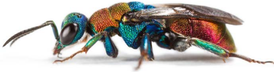
Sandgoldwespe ( Hedychrum nobile)