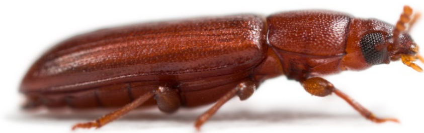
Rotbrauner Reismehlkäfer ( Tribolium castaneum)