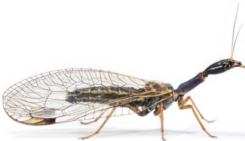
Kamelhalsfliege ( Dichrostigma flavipes)