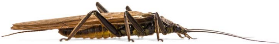
Steinfliege ( Perla marginata )

Die Nutzung der Fotos ist für die Berichterstattung unter Nennung des Copyrights kostenfrei.