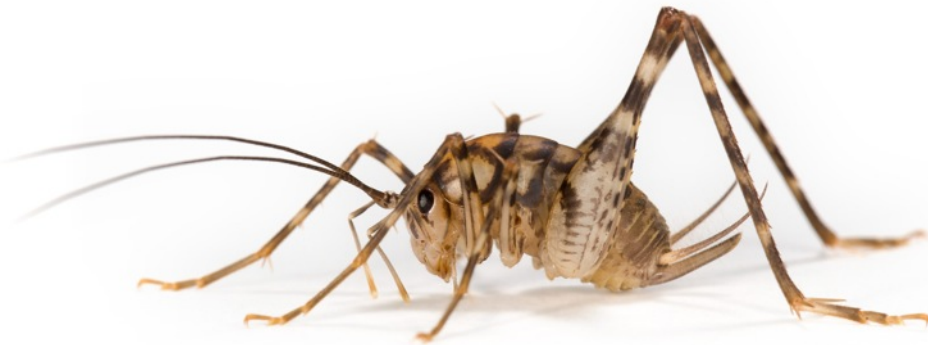
Schrecke ( Diestrammena asynamora)